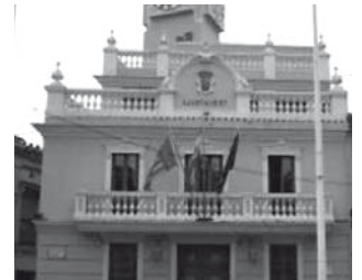
Ajuntament de Meliana 1923