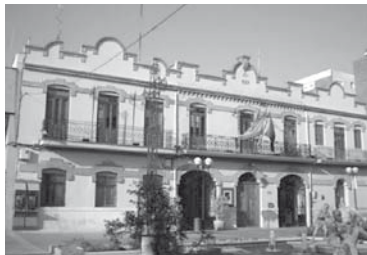
Ajuntament d'Almàssera 1927