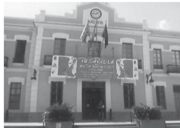
Ajuntament de Burjassot 1915