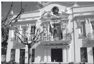
Ajuntament de Tavernes Blanques 1927