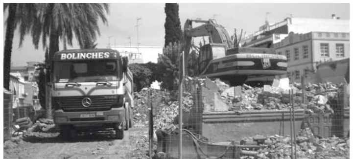
Ajuntament de Bonrepòs i Mirambell †